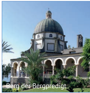
Berg der Bergpredigt