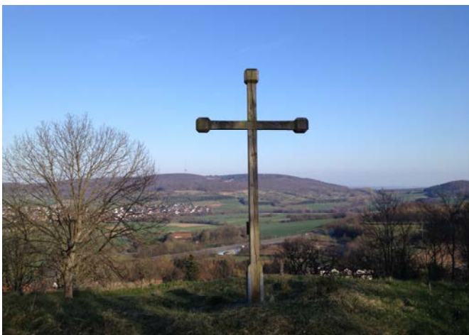
Heimeradskreuz auf dem Hasunger Berg, 1996 errichtet über dem Grab des hl. Heimerad durch Pfadfinder aus Meßkirch.

Kirchstraße 22, 34311 Naumburg, Tel. 05625-340, sankt-crescentius-naumburg@pfarrei.bistum-fulda.de